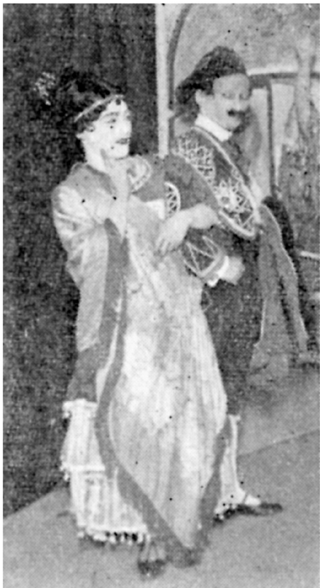
第二次カジノの舞台『珍カルメン』より。エスカミリオ役の堀井英一（右）とカルメン役のエノケン（左）。堀井は米国喜劇俳優ベン・ターピンのメーキャップをしている。