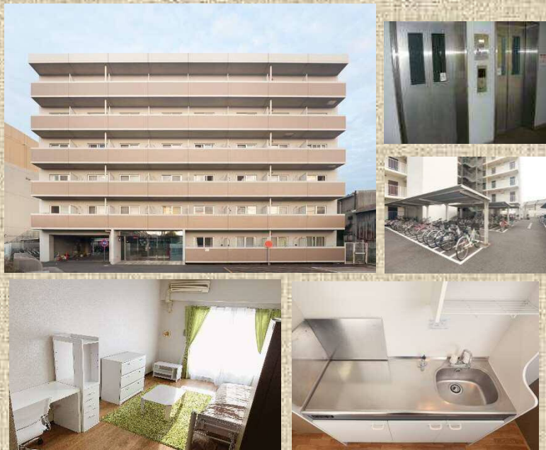
※お部屋の写真はモデルルームです。家具等は付いておりません。