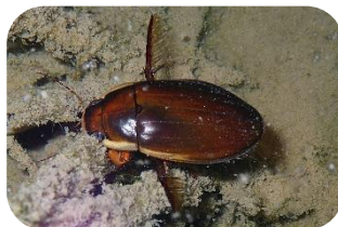
シャープゲンゴロウモドキ