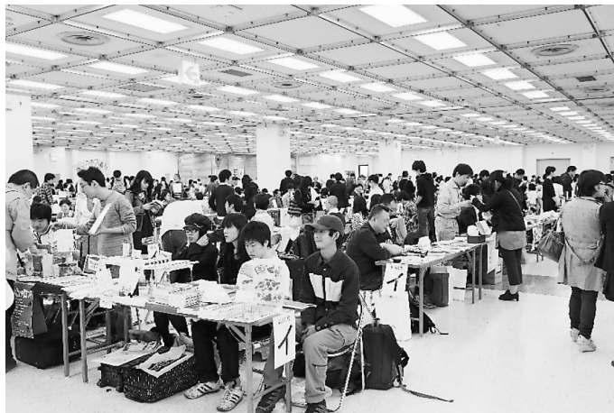
多くの来場者が訪れた文学フリマ

とで刺激がえられる」といっている。自分の作品を赤の他人に見てもらって、切実な感想や、作品の質をさらけ出すのだ。