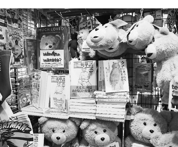
所狭しとならんだ雑貨のなかに関連本をおいているヴィレッジヴァンガードの棚

「若者が読書しなくなっている」といわれるが本当か。若者よりの本屋が本を売らなくなっている。