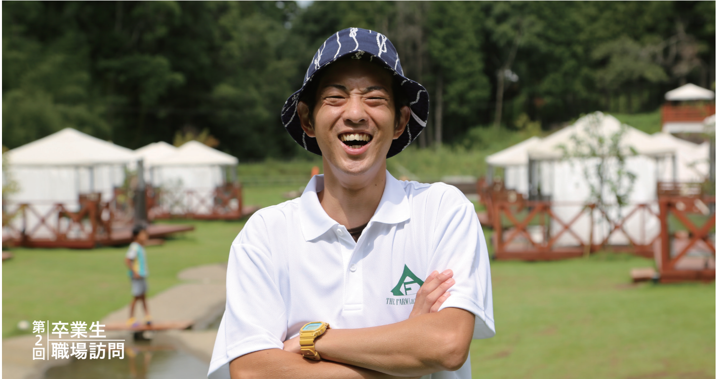
第2回 卒業生 職場訪問